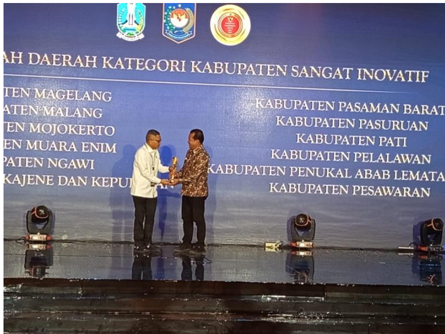
Pemberian Penghargaan Kategori Kabupaten Sangat Inovatif dari Kementerian Dalam Negeri RI.