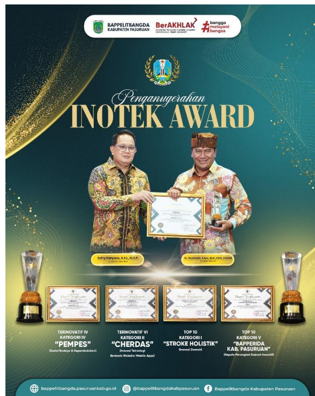
Pemberian Penghargaan dari Pj Gubernur Jawa Timur